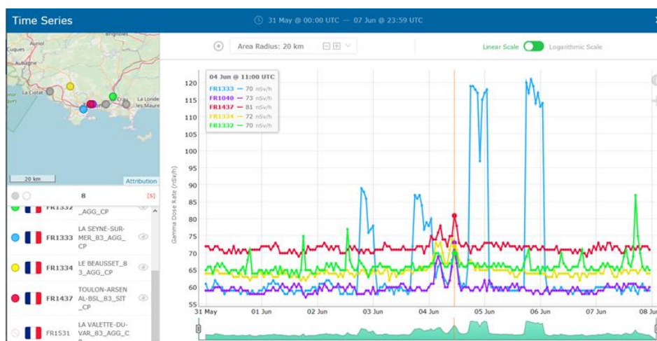
Graphe 1 : Débit de dose gamma enregistré par les balises Teleray du 31 mai au 7 juin 2020 autour de Toulon

Parmi les hypothèses plausibles, la CRIIRAD a immédiatement envisagé celle de tirs de gammagraphie. Ces opérations sont en effet souvent effectuées en soirée pour limiter les risques de présence de personnels dans l'environnement de la zone où a lieu le « tir ».