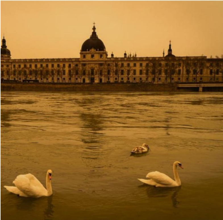
chargé de sable du Sahara donne une teinte ocre à la ville.

puissance de celle d'Hiroshima, explose au sommet d'une tour métallique. Dans les jours qui suivent, les particules radioactives sont repérées au Mali, au Tchad, en République centrafricaine... D'anciennes colonies françaises indépendantes depuis 1958. Le nuage continue son chemin et laisse des traces en Sicile, en Espagne, et jusqu'en Suède. Depuis Paris, le général s'exclame : « Hourra pour la France ! » Mais tout le monde ne partage pas son enthousiasme. Une salve de protestations accueille Gerboise bleue, le Nigeria étant particulièrement virulent. Après trois autres essais atmosphériques, il est décidé de passer aux tests souterrains. Le premier a lieu en novembre 1961, au même endroit. Quelques mois plus tard, la France accorde l'indépendance à l'Algérie par les accords d'Evian, dont une clause, longtemps restée secrète, autorise l'ancienne tutelle à poursuivre pendant cinq ans son programme de recherche nucléaire. Pour l'essai Béryl, programmé le 1 er mai 1962, une délégation s'est déplacée de Paris, avec à sa tête le ministre des Armées, Pierre Messmer, et de la Recherche scientifique, Gaston Palewski. Pour mener Béryl à bien, on a creusé des galeries dans le granit et enfoui la bombe au cœur de la montagne du Taourirt Tan Afella. Mais au bout du compte à rebours, rien ne se passe comme prévu. Le bouchon de béton censé contenir l'explosion est pulvérisé et la montagne s'ouvre comme la