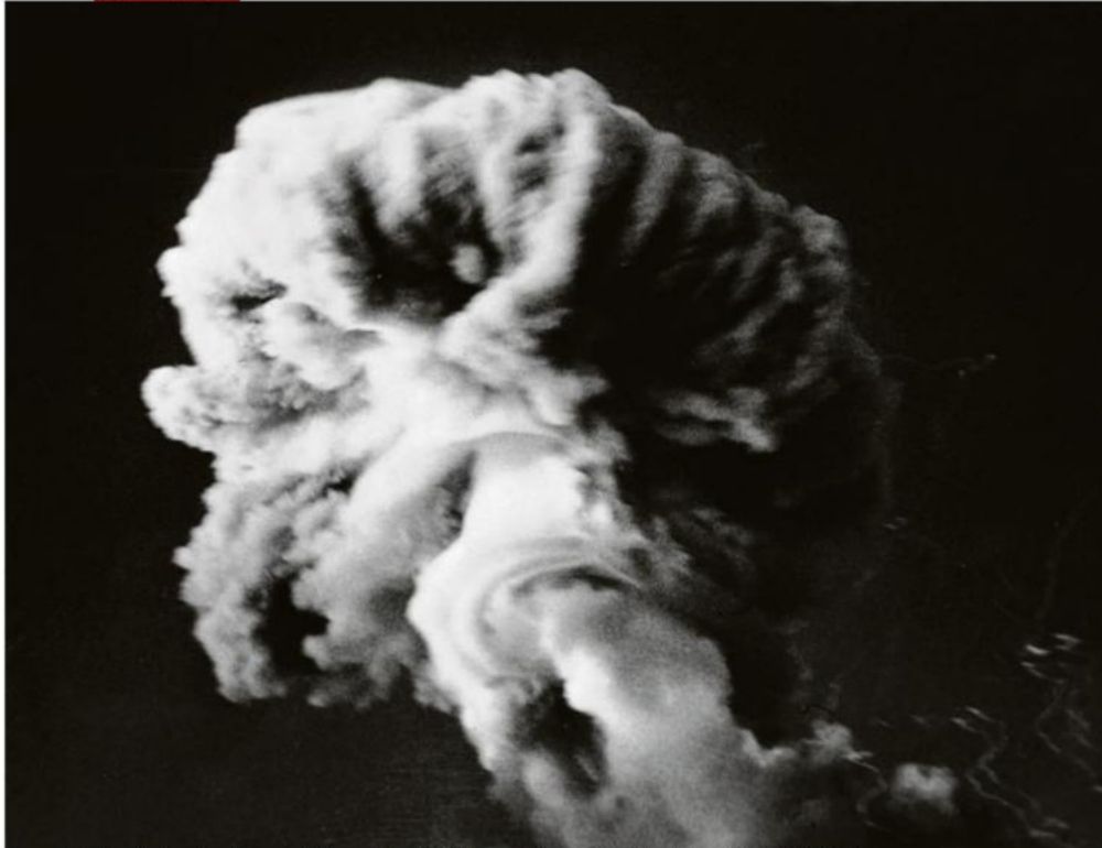
La première bombe atomique française à Hamoudia près de Reggane dans le désert du Sahara le 13 février 1960.