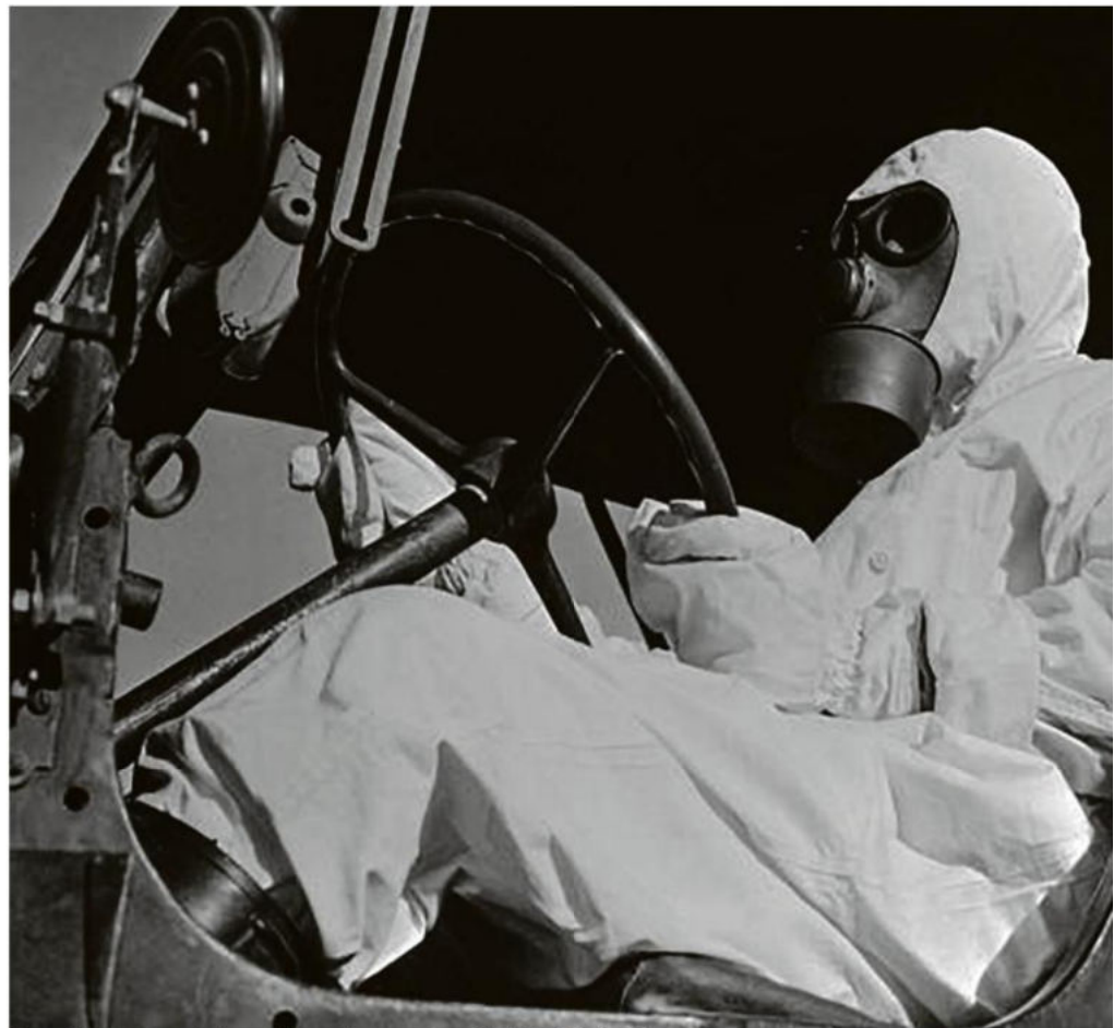
Un expérimentateur revêtu de son vêtement de protection en Algérie le 14 février 1960.